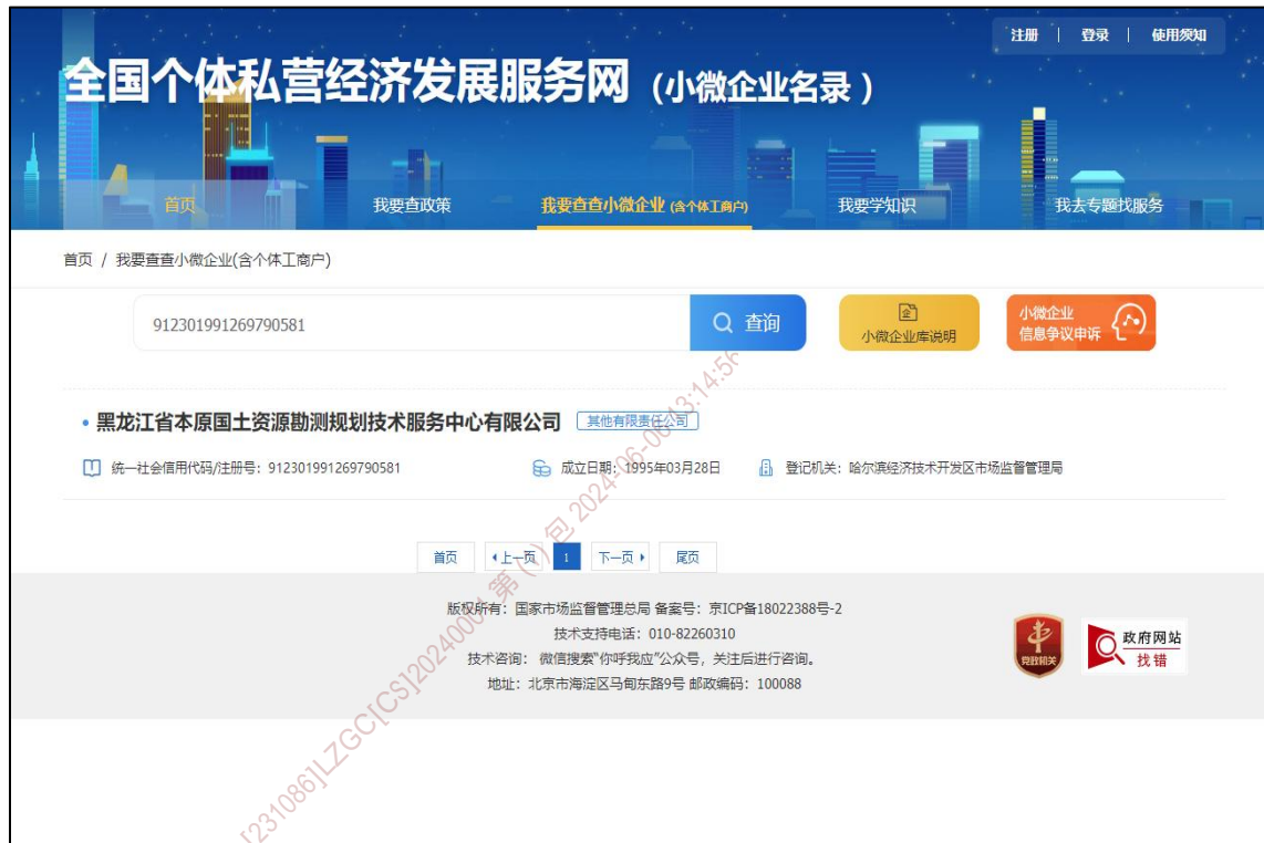
附件：小微企业名录查询截图