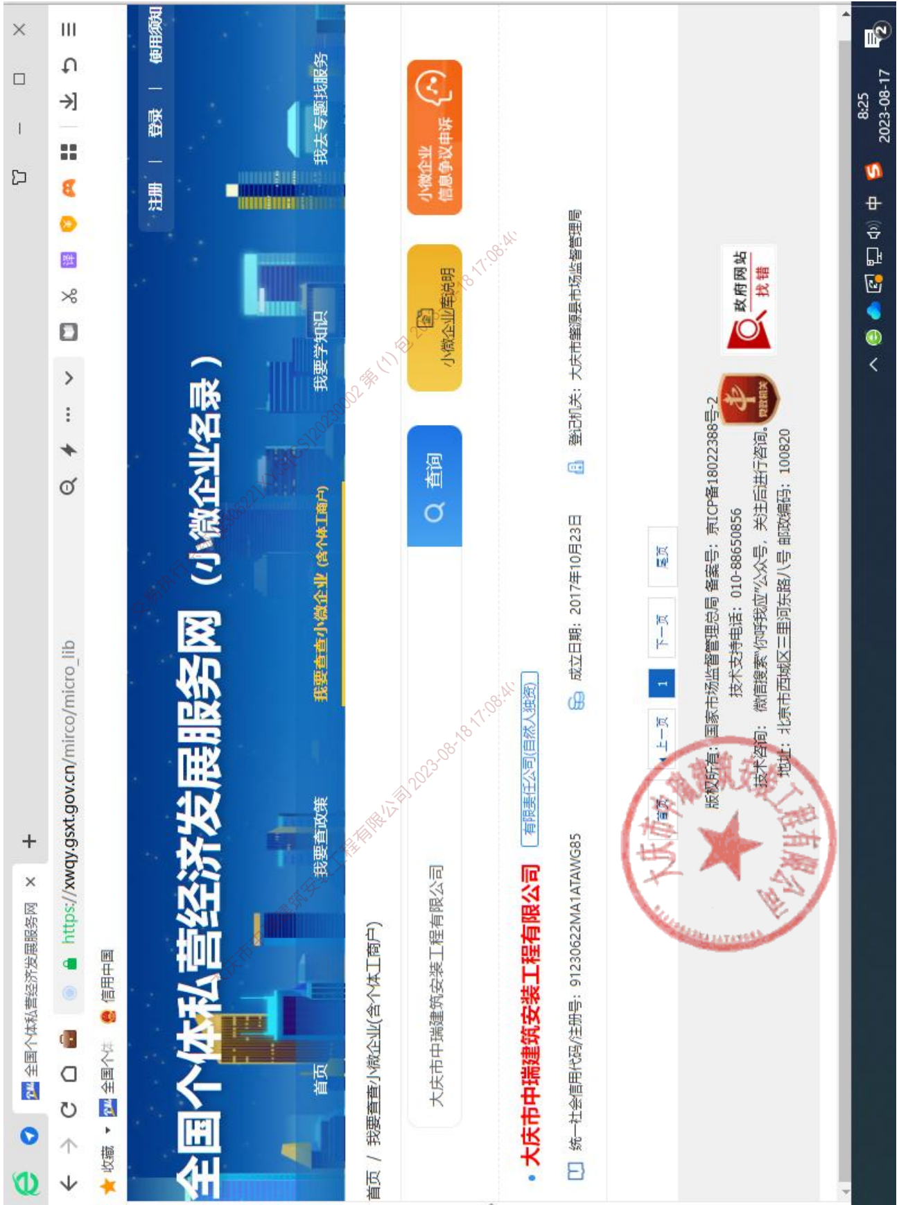
附：在“小微企业名录”网页截图