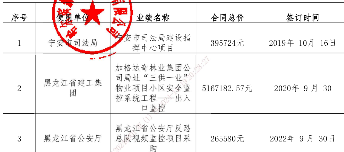
投标人业绩情况表

交易执行系统 [230406] HZGL16K320231119 (1) 2024-11-19 20:28:27