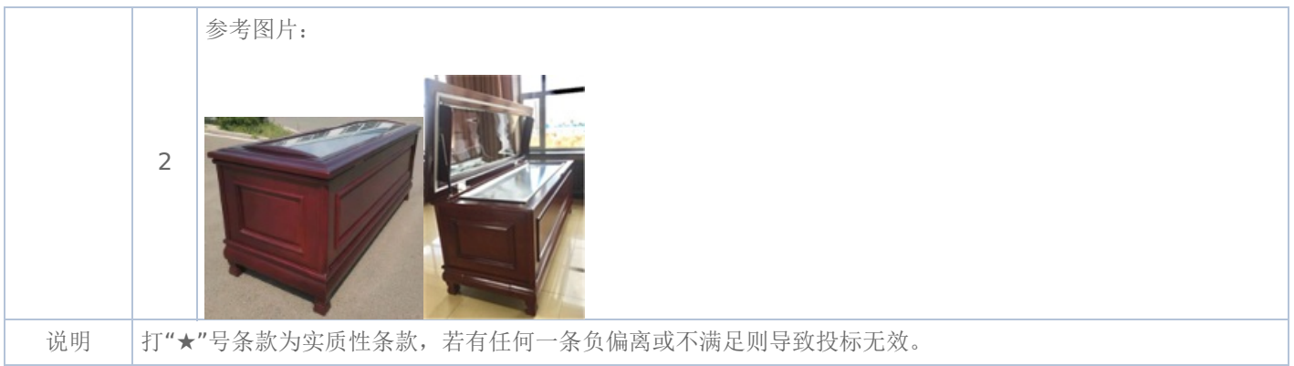
附表三：告别台 是否进口：否