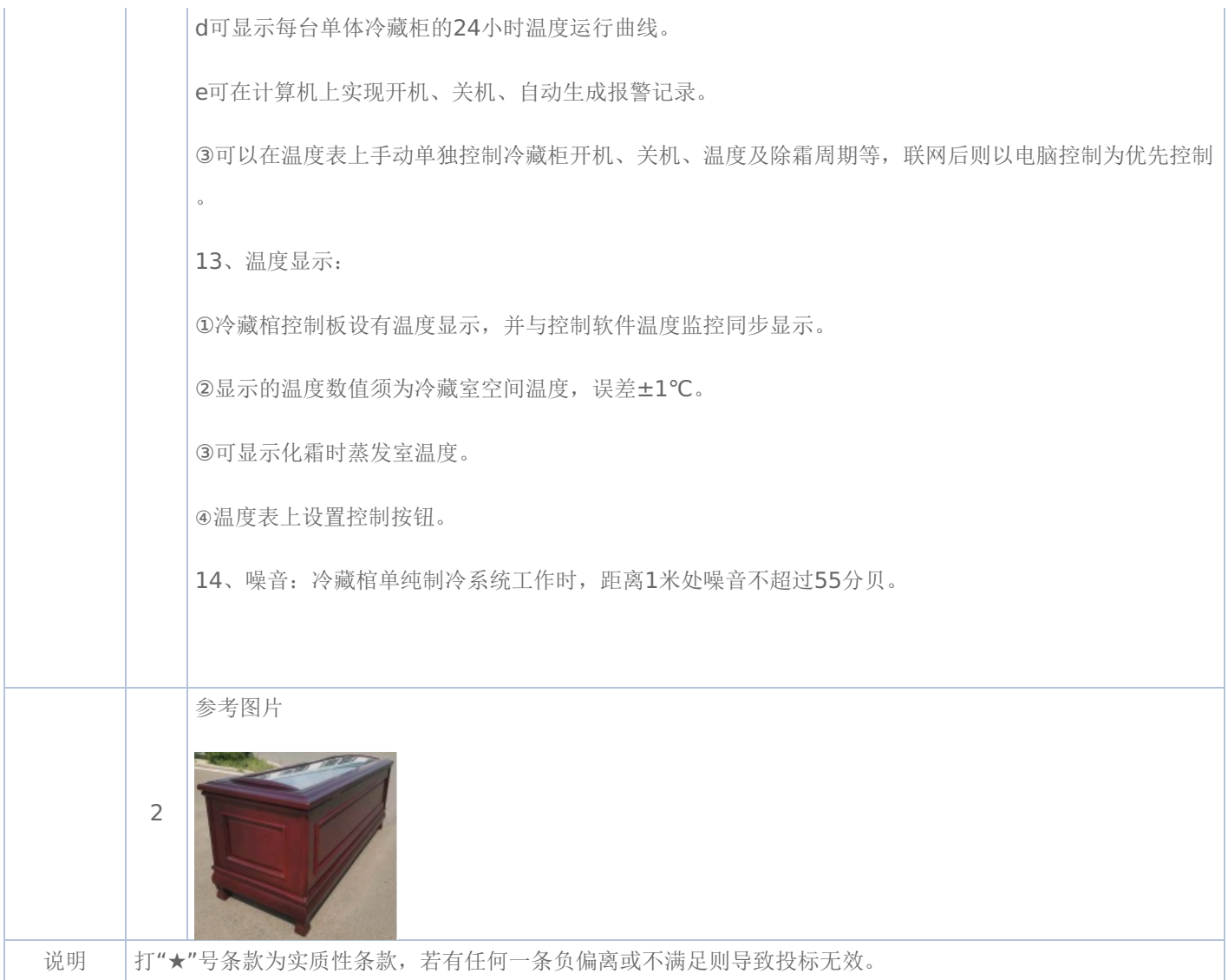
附表二：升降式冷藏棺 是否进口：否