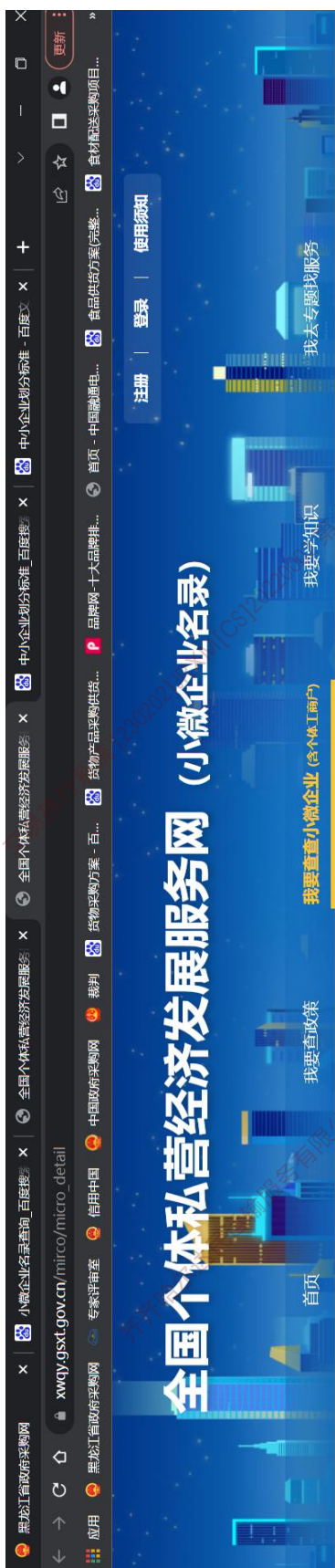
勃利元盛食品有限公司小微企业名录截图